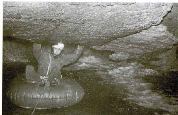
L'any 1970 a la cova de los Chorros (Albacete). Calar del Mundo.

No em pensava que tornés al Serrat del Vent. Va ser diumenge, dia 25 de març del 2007, després de més 25 anys i, encara menys per acompanyar-te per últim cop, igual que la primera vegada. També hem fet 300 metres plegats, amb tu al davant, però aquesta vegada