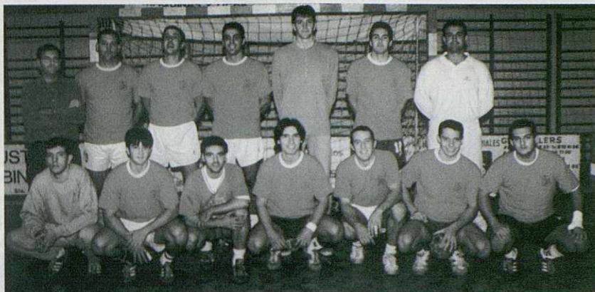
Planter del BM Palautordera