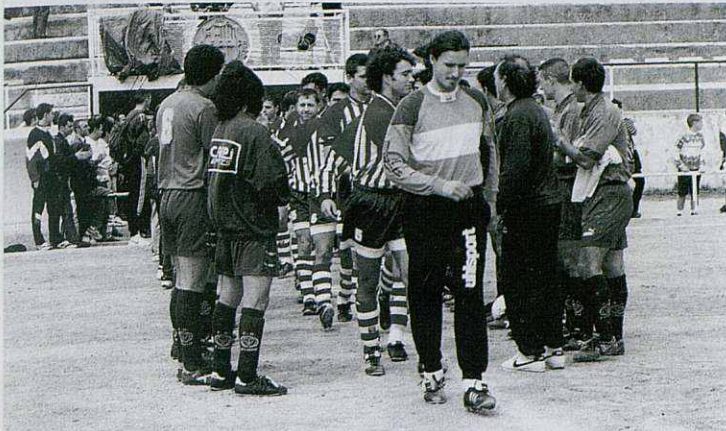
El Pómar realizó el pasillo de campeón al Cardedeu