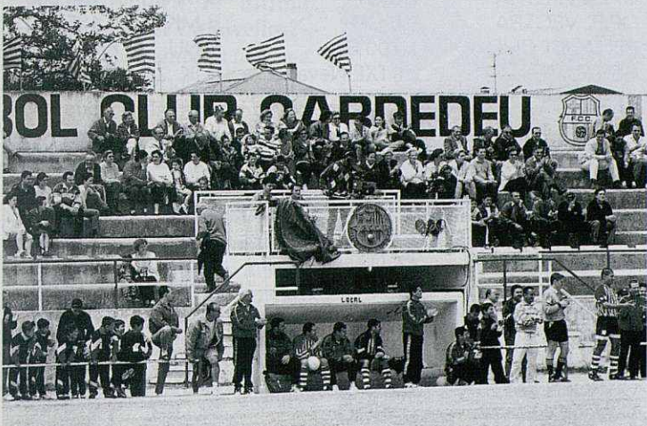
Ambiente de gala en las gradas