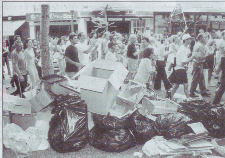
Al amanecer la huelga era patente: la basura no se recogió por la noche.