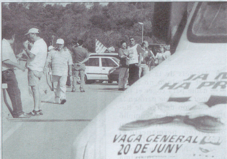
Los piquetes cortaron el puente de acceso a La Roca Village.

En el sector sanitario también se trabajaba en función de los servicios mínimos pactados entre las organizaciones sindicales y la Administración catalana. Tanto en la Mútua, como en el Hospital General y en la Policlínica estaban abiertos al público los servicios de urgencia así como se realizaban los trabajos más urgentes de laboratorio y de radiología. También, según confirmaban fuentes de estos centros, se llevaron a cabo las