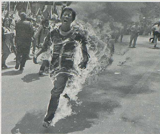
Manifestació desesperada a favor del poble tibetà.

¿O bé que un missioner anés als maputxes, de l'estat de Xile, i els digués que prou resistir-se a la cultura castellana que en nom de la civilització fa cinc-cents anys que primer els espanyols i després els xilens els estan imposant, mentre ells no volen canviar de cultura, volen la seva, la maputxe-araucana i no es rendeixen?