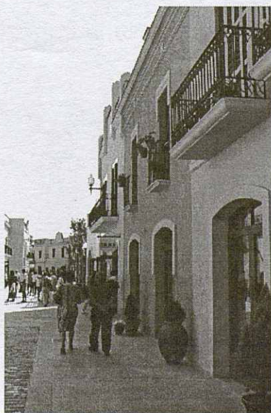
Les façanes dels edificis recorden un poble mediterrani de finals del s. XIX.