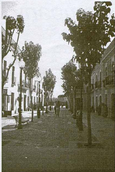
Imatge del passeig.