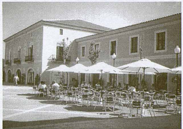
Les cafeteries i els restaurants amenitzen el parc comercial.