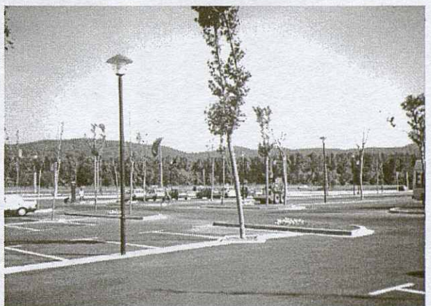
Vista de l'aparcament de la Ciutat Comercial.