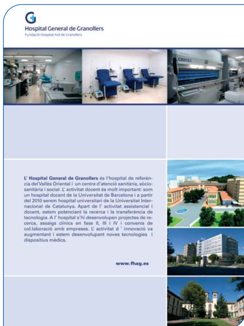
Pòster corporatiu presentat al Fòrum de la BioRegió

El passat 4 de desembre la Unitat de Recerca de l'Hospital General de Granollers va participar a la primera edició del Fòrum de la BioRegió , una trobada del sector biotecnològic i biomèdic a Catalunya sense precedents, organitzada per Biocat amb l'objectiu de dinamitzar i consolidar el bioclúster, en la qual s'han reunit més de 500 profes-