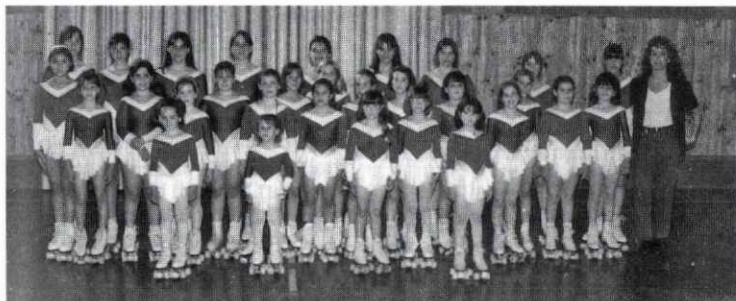
Grup de patinadores del Club patí Santa Eulàlia.