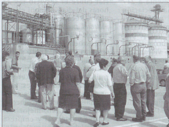
Desde esta semana se está llevando a cabo la II Jornada de puertas abiertas del sector.

Los vecinos de Sant Celoni ya tienen la oportunidad de conocer por dentro las industrias químicas que les rodean. Desde esta semana se está llevando a cabo la II Jornada de puertas abiertas del sector en las que cada empresa participante da a conocer su forma de trabajo y las mejoras medioambientales y de calidad que se han realizado en los últimos tiempos. Asimismo, han dado a conocer sus principales magnitudes. De esta forma, se ha sabido que en el curso del año 2001 el conjunto de todo el sector en Sant Celoni, las trece empresas que forman parte del Plaseqtor, facturaron un total de 745 millones de euros y que da ocupación directa a 1.660 personas, de las cuales 27 se ocupan de la