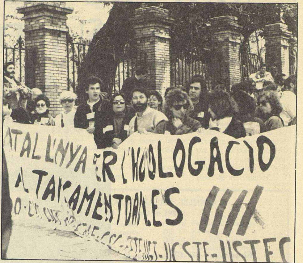
Los maestros llevan siete meses manifestándose

—Busqui un sistema per tal d'impedir que un director hagi d'anar a judici a donar explicacions de les lesions que un alumne del seu centre s'ha