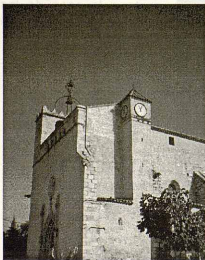
Església de Sant Sadurní.

Darrera l'altar major trobem un retaule, obra de l'artista Antoni