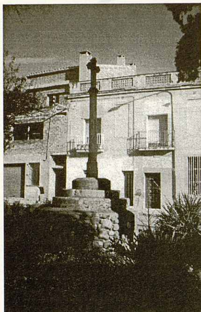
Creu de Terme.