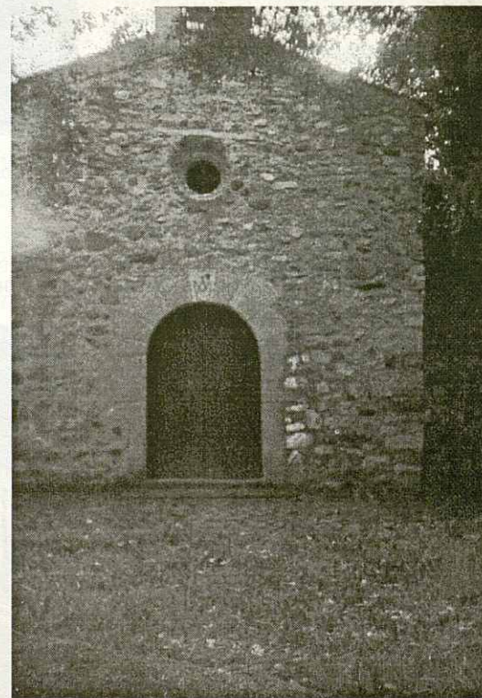
Ermida de Santa Maria de Malanyanes.