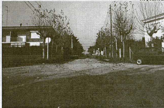
L'asfaltat de carrers s'emporta gran part de les inversions

Ja al ple del mes de febrer, l'alcalde de la Roca Salvador Illa va destacar-ne la rapidesa amb què s'havia presentat, ja que el de l'any passat s'havia fet el 5 de maig. Illa també va remarcar que el pressupost per al 1996 s'havia fet amb prudència, perquè l'auditoria encara no havia clarificat l'estat econòmic del consistori i perquè, a més, encara no s'havia tancat l'exercici del