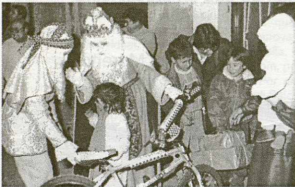
Els Reis Mags vinguts de l'Orient entregant els regals als nens i nenes de la Roca.

El Nadal és la festa de la felicitat, la festa del color i del caliu de casa, la festa dels nens i dels que ja no són tan nens. Al Nadal els carrers són plens de llums, les botigues són plenes de menjars suculents i de regals per regalar, la gent del carrer sembla que camina amb un altre somriure i el mateix temps fred convida a recollir-se a casa, a seure amb la família i a mirar-te-la, pensant que mai estareu tan units.