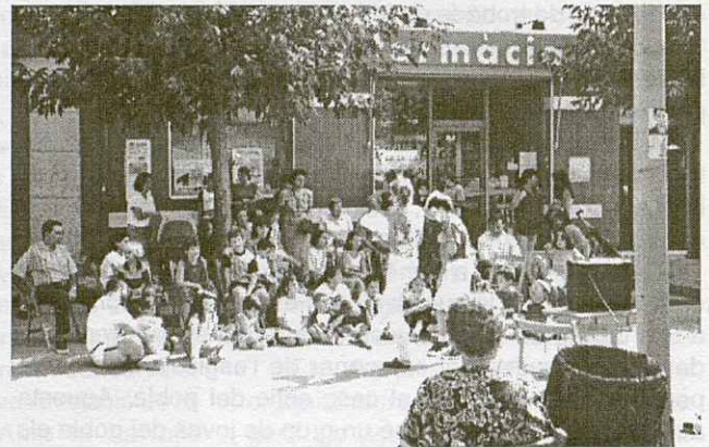
Els menuts també van poder gaudir de la festa.