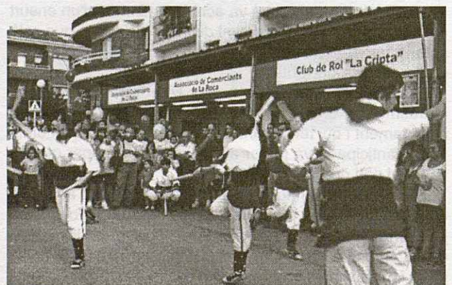
El Ball de Bastons recorregué diversos indrets del poble.

Un dels actes més esperats d'aquesta Festa Major fou la inauguració de la III Mostra d'Entitats del Municipi que és una de les grans revulsions de les Festes Majors dels passats anys. La mostra ha donat un caire diferent a la Festa Major. És un punt de trobada de molta gent del municipi que volen passejar per un carrer on hi trobaran les entitats que donen vida cultural, esportiva, etc., al municipi. Aquest any, doncs, encara que només és el tercer, la Mostra s'ha consolidat com un element fonamental de la Festa Major i ha de ser una activitat a potenciar per tal que altres entitats es sumin a la iniciativa de participar-hi i donar-se a conèixer. Donar a conèixer qui són, quines activitats porten a terme durant l'any, etc. .