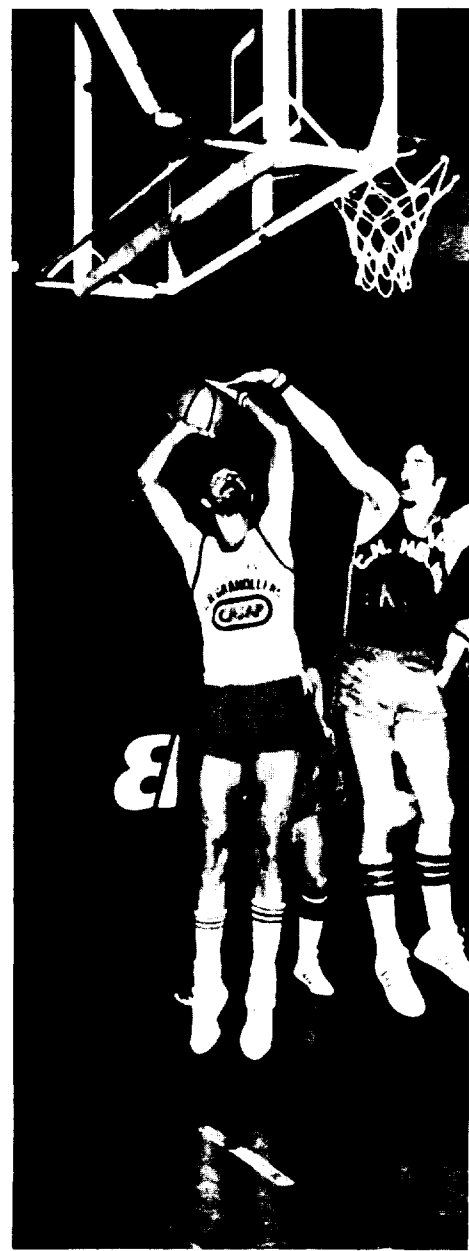
Góngora luchando que no se entre