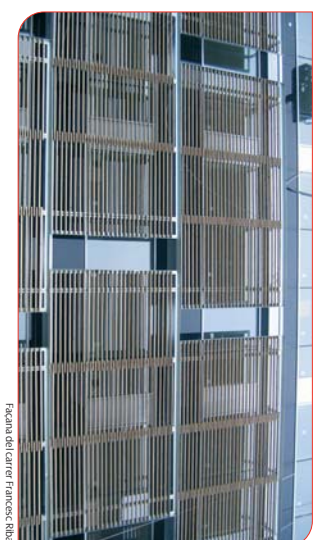
Facana del carrer Francesc Rodas

En els propers mesos s'equiparan les consultes i els despatxos del nou edifici d'atenció ambulatoria, així com també es posarà en funcionament la sala 5 dels nous equips de Diagnòstic per la imatge.