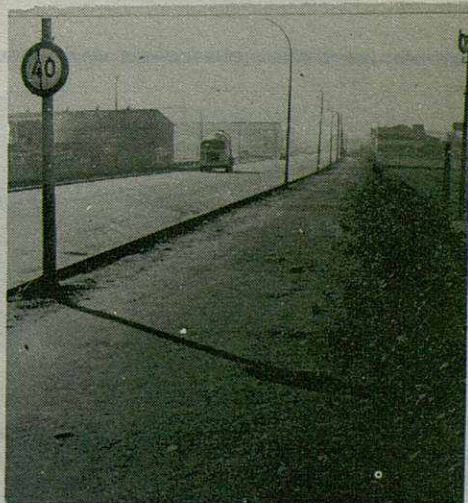
Los camiones tienen preferencia