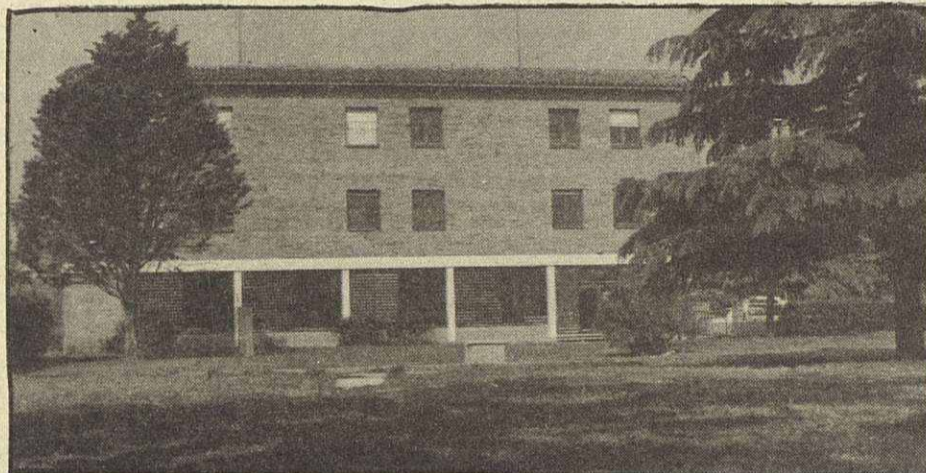
Escola Àngel de la Guarda, al Camí de Can Vila, al barri de Lourdes

Els altres dos centres pertanyents a l'Institut són l'Escola d'Educació Especial Angel de la Guarda, al camí de Can Vila s/n (barri de Lourdes) tel. 593 02 00 i el Taller Alborada, que són tallers ocupacionals per a majors de 16 anys, al carrer Lluís Millet, s/n, tel. 593 93 53.