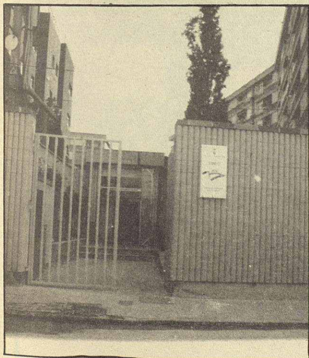
Façana de l'Empresa Municipal de Formació i Ocupació, al carrer Roger de Llúria, 43-45

EMFO és una empresa municipal creada per gestionar i desenvolupar tots els projectes i programes de formació ocupacional i de promoció de l'ocupació. Podeu anar allà si teniu necessitat d'informació sobre l'atur, els cursos de formació, etc.