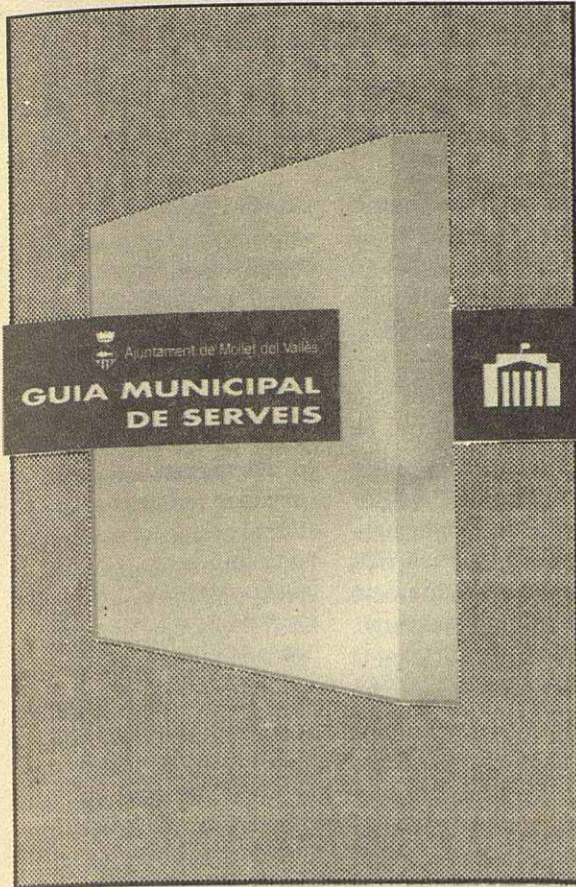
Portada de la Guia

L'Ajuntament ha repartit, per tots els domicilis de Mollet, aquest final de setembre, més de 14.000 exemplars de la Guia Municipal de Serveis. Aquesta Guia que, segons paraules de l'alcalde "ha estat el resultat d'una voluntat municipal de posar a l'abast dels ciutadans de Mollet una eina útil i manejable d'informació de serveis municipals i d'altres organismes", ha tingut una tirada de 17.000 unitats i ha comptat amb un destacat ajut econòmic de l'entitat financera de la Caixa de Pensions, "La Caixa".