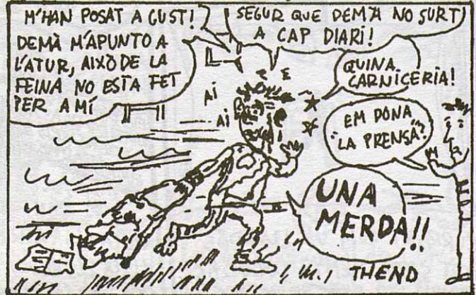
DEDICAT A LA UNIO DE PAGESOS I A LA GENT DE LES TRACTORADES.