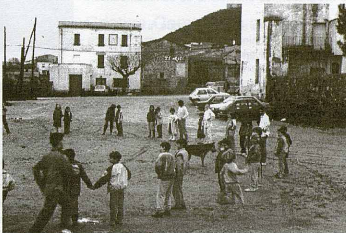
Grup de l'esplai jugant a la plaça St. Jordi 1987.

La cosa més divertida que jo recordo, no sé si es pot dir divertida, va ser quan vaig tornar malalta quan estava de campaments.