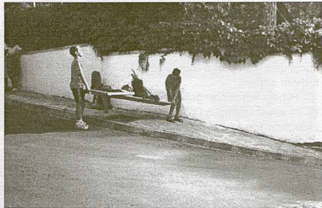
...encara, que no tots, van poder acabar.