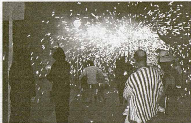
El correfoc va ser espectacular.