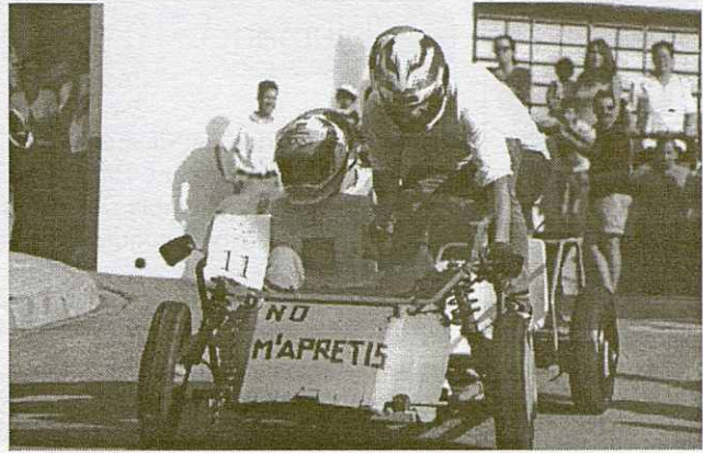
La baixada de carretons fou intensa, emocionant, ràpida...