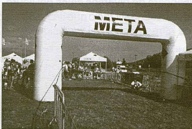
Les probes requerien una alta preparació física així com un bon sentit de l'orientació.

amb la "prova Scoti " en la qual cada equip havia de formar un circuit o ruta a seguir per aconseguir totes les balises marcades al mapa.