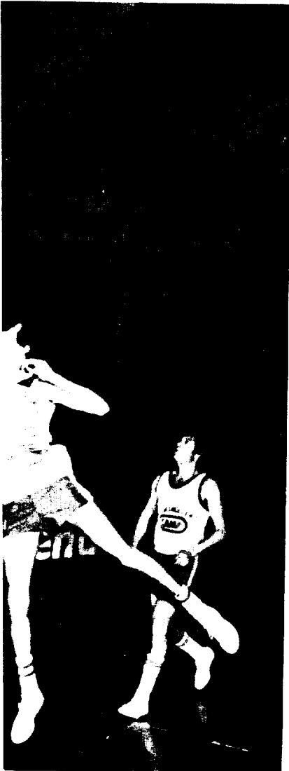
Factor decisivo para la victoria