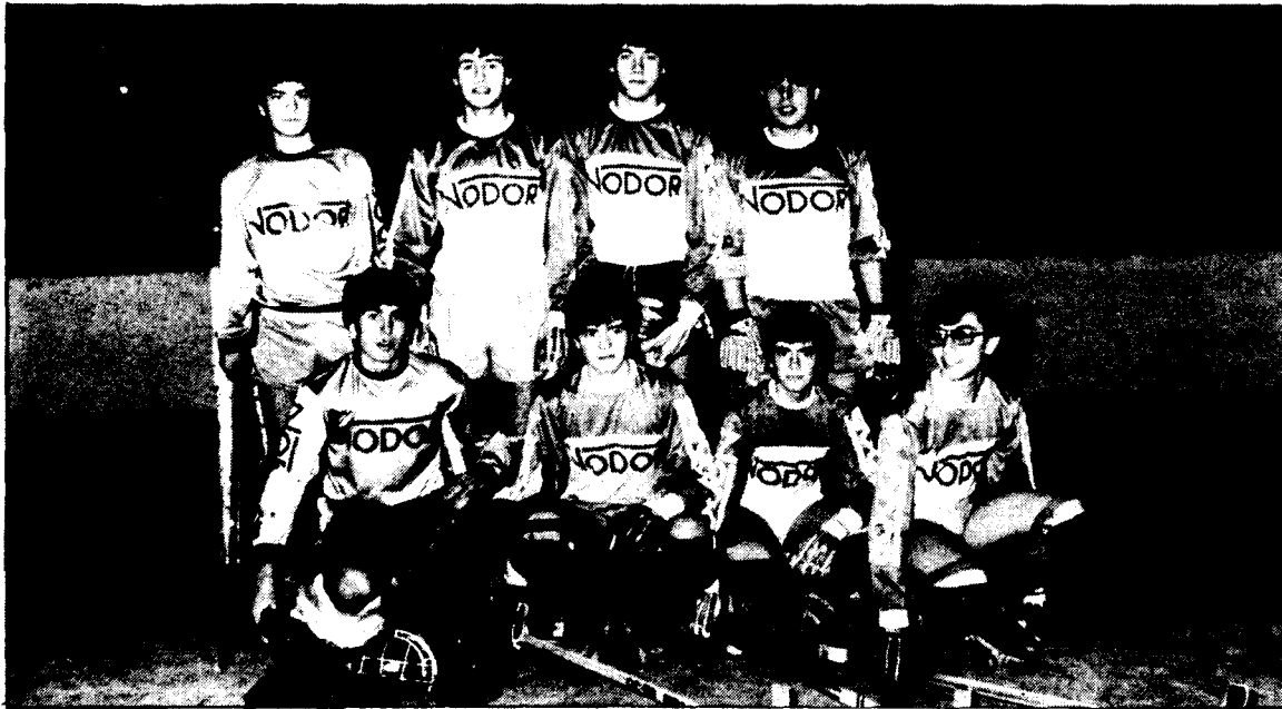
La Garriga (juvenil)