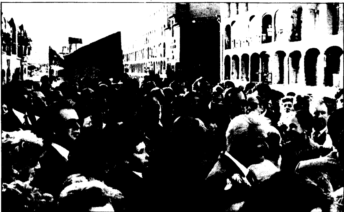
Molta gent al cementiri de Mataró