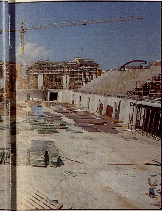
A principios de 1991 se presenta a la ciudad el cuerpo de gradas